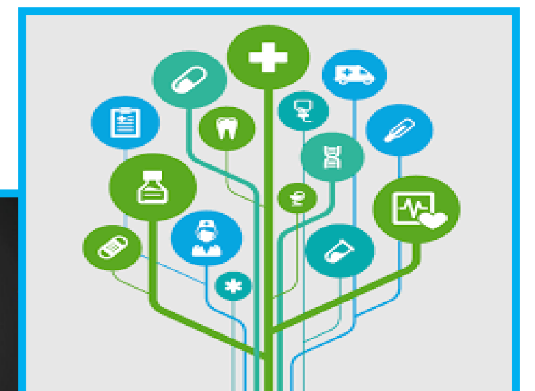
Figura 2: Representando alguns componentes multidisciplinares, retirada da internet, referência abaixo.